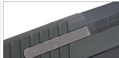
エキストラクター形状を再現