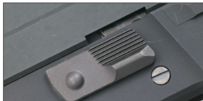
ティクダウンレバー位置をリアルに再現