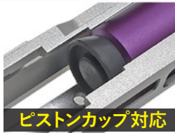
ピストンカップ対応