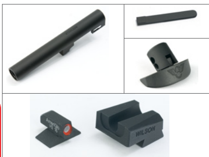
Wilson Combatタイプ リコイルスプリングガイド付属