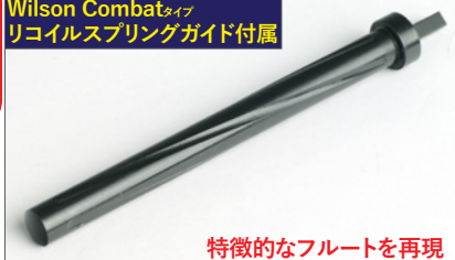
特徴的なフルートを再現